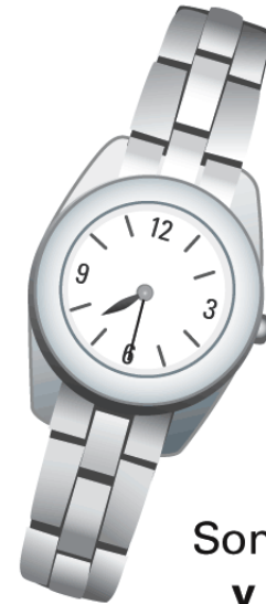
Son las siete y treinta .