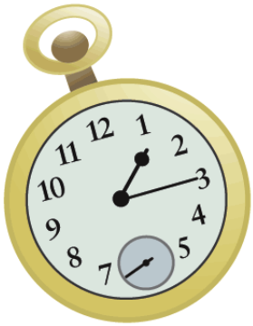
Es la una y cuarto .