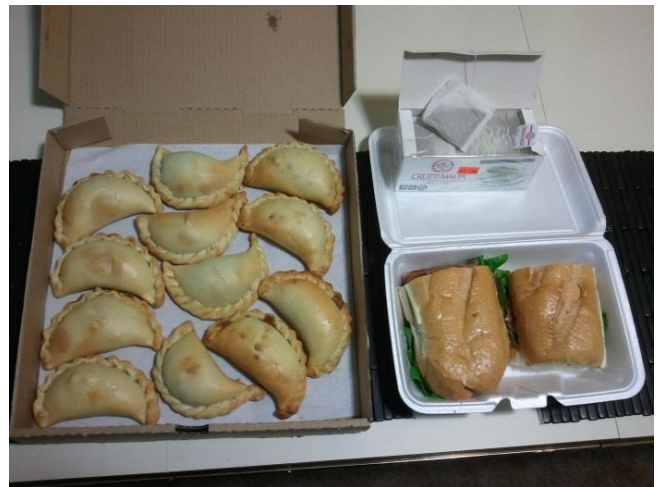
Aquí esta la comida que yo compré. Pusieron las empanadas en una caja de pizza.