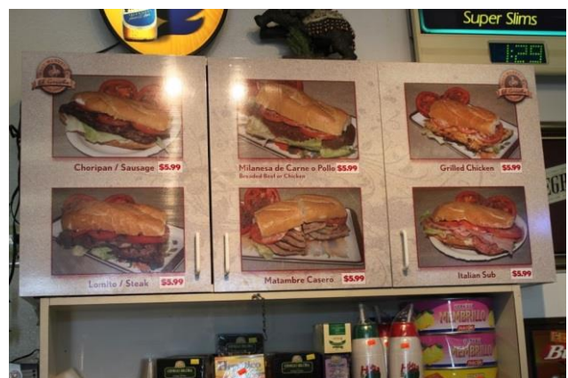
Aquí es donde ordenas la comida. Tienen varias cosas interesantes, como diferentes sandwiches.