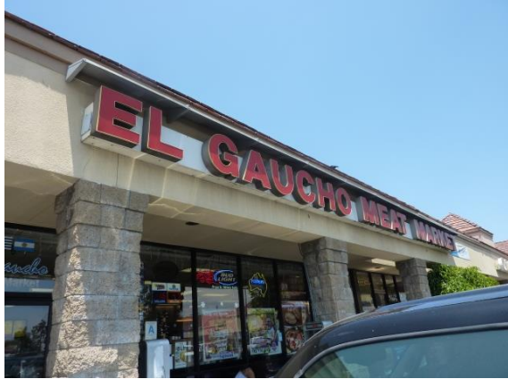
Aquí está el exterior de la tienda.