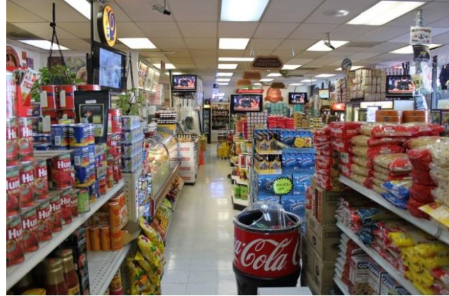
Este es el interior de la tienda.