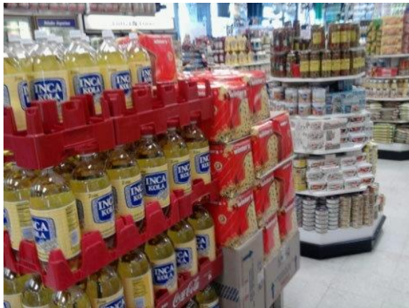
Tienen productos que no conozco, como Inca Cola. También venden carne cruda.