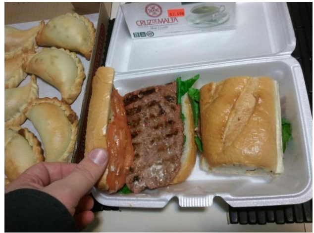
Compré empanadas de pollo, espinaca, y carne. El choripan tenía chorizo, tomate, y lechuga.